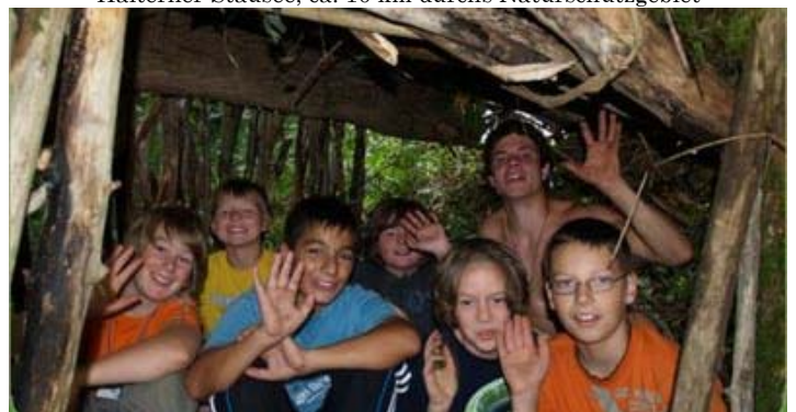
Buden bauen im Wald