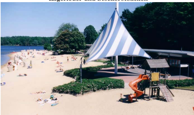
Strandbad Halterner Stausee – Öffnungszeiten und Preise s. http://www.seebad-haltern.de