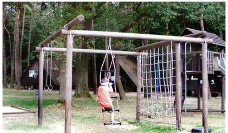
Spiel und Sport am Platz