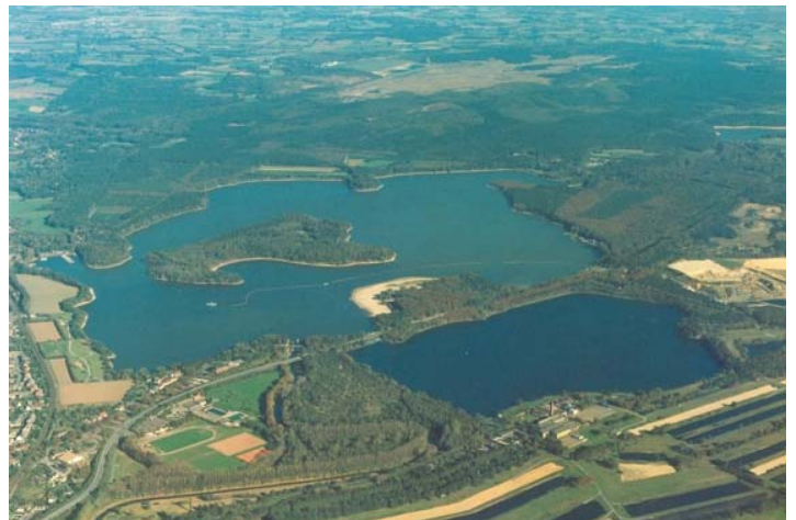
Halterner Stausee, ca. 10 km durchs Naturschutzgebiet