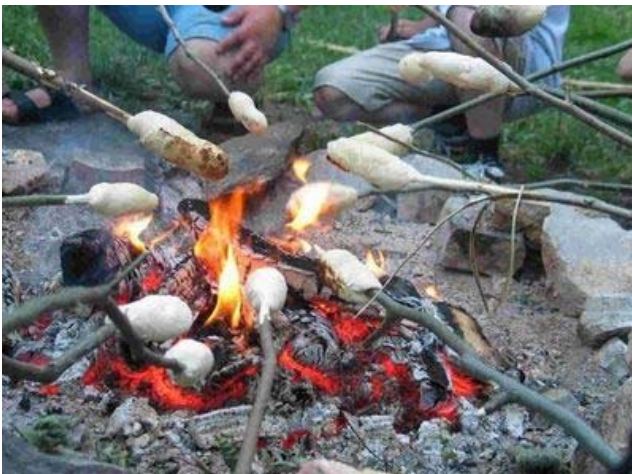
Lagerfeuer und Stockbrotbacken