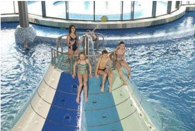
Ausflug ins Marition (weniger als 3 km Fußweg)