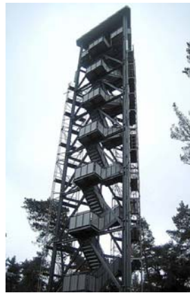
Naturschutzgebiet Haard entdecken